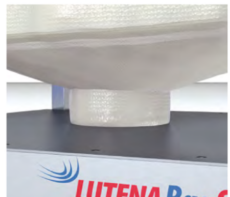
Massive Produkthalteplatte mit angepasster Öffnung zum selbstständigen, staubfreien Verschluss des Big-Bag Auslasses.