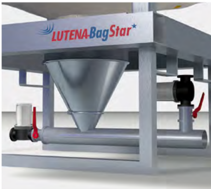
Integrierbarer Anschluss für Förderadapter